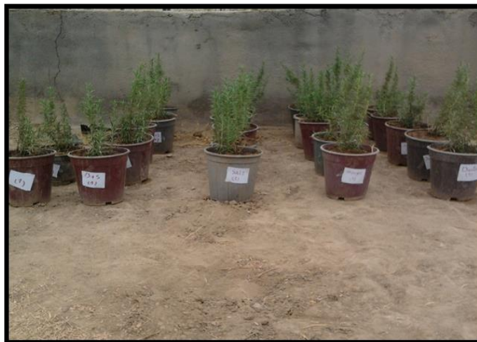
شکل ۱- شیوه کشت گونه رزماری در طرح آزمایش Figure 1- Rosmarinus Officinalis in the experimental design

در آغاز دوره گل‌دهی، ۵ پایه از گیاهان کشت شده در گلدان‌ها را به همراه ریشه‌ها به‌دقت از گلدان خارج کرده و صفات مورد نظر شامل ارتفاع گیاه، وزن تر و خشک ریشه و اندام هوایی و هم‌چنین وزن خشک تولیدی در واحد مترمربع اندازه‌گیری و محاسبه گردید. برای تعیین میزان اسانس از روش استخراج و تقطیر با بخار به‌طور هم‌زمان با یک حلال آلی و دستگاه SDE ۲ (ساخت شرکت اشک شیشه ایران) استفاده گردید به این صورت که ۵۰ گرم از بخش هوایی خشک شده گیاه کاملاً خرد شده و در بالن ۲۵۰ سی‌سی ریخته و به آن میزان ۱۵۰ سی‌سی آب مقطر اضافه گردید. بعد چهار ساعت با دانستن وزن ماده خشک گیاه و وزن اسانس، از طریق تناسب بازده اسانس به‌صورت درصد مشخص شد.