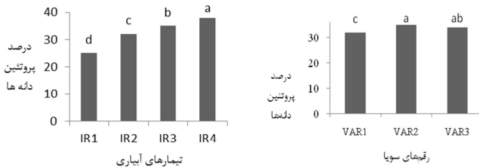
شکل ۱- مقایسه میانگین درصد پروتئین دانه تحت تأثیر رقم های مختلف سویا و تیمارهای مختلف قطع آبیاری (IR1: آبیاری نرمال، IR2: قطع آبیاری در مرحله رشد رویشی، IR3: قطع آبیاری در مرحله گلدهی، IR4: قطع آبیاری در مرحله پر شدن دانه، VAR1: رقم ویلیامز، VAR2: رقم M9، VAR3: رقم زان) (میانگین های دارای حروف مشترک در هر ستون در سطح پنج درصد اختلاف معنی داری با یکدیگر ندارند) (آزمون LSD)

نتایج این آزمایش نشان داد که، بالاترین درصد پروتئین دانه (۳۸ درصد) در زمان قطع آبیاری در مرحله پر شدن دانه و همچنین بالاترین میزان آن در رقم M9 به دست آمد که با رقم زان از نظر آماری تفاوت معنی داری نشان نداد (شکل ۱). علاوه بر این، بالاترین مقادیر عملکرد پروتئین در زمان آبیاری نرمال (۱۰۸) و در رقم ویلیامز (۱۰۰) به دست آمد (شکل ۲). به نظر می رسد، تنش خشکی از دو طریق بر کمیت و کیفیت دانه سویا تأثیر می گذارد؛ یکی این که با بسته شدن روزنه ها و کاهش فتوسنتز، آسیمیلات کمتری به دانه ها منتقل و عملکرد دانه کاهش می یابد و دیگری این که با تأثیر بر تثبیت نیتروژن، نیتروژن مورد نیاز گیاه تأمین نشده و کاهش عملکرد دانه و درصد روغن و پروتئین دانه مشهود می گردد. هم چنان که مک کالم و همکاران (Mccallum et al. , 2000) و کاسور و همکاران (Kausar et al. , 2006) بر این نکته تأکید نموده اند که، کاهش کمیت و کیفیت دانه سویا به دلیل کاهش نیتروژن موجود در گیاه تحت تأثیر تنش خشکی می باشد.